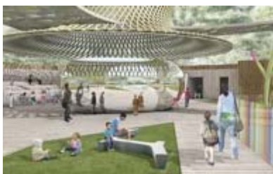
Parc pour enfant