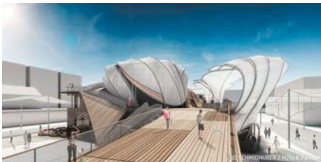
© Schmidhuber / Milla & Partner