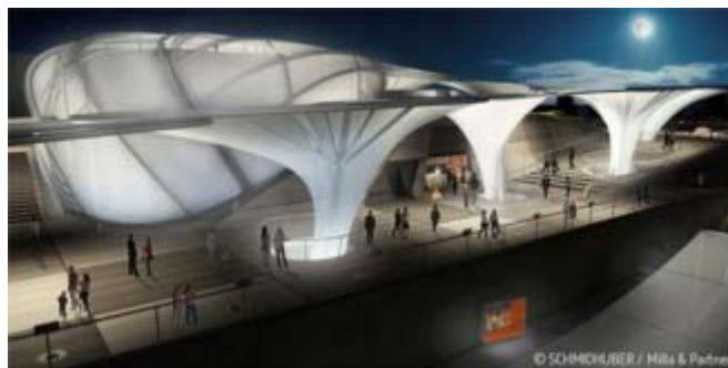
© Schmidhuber / Milla & Partner