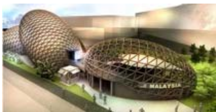
Pavillon de la Malaisie