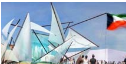
Pavillon du Koweït