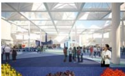
Cluster Bio-Méditerranéen et Aride